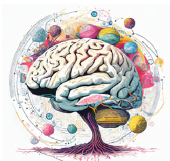
Figure 1 : Le cerveau et ses connexions neuronales (Midjourney, 2024) (IA-2-IMG)